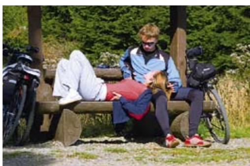
Cyklisté v Jeseníkách

Možnosti ubytování, stravování a služeb pro cyklisty splňující podmínky projektu Cyklisté vítání – např. ubytování na jednu noc, vyprání a usušení oblečení a výstroje, uzamykatelná místnost pro bezplatné uschování jízdních kol, atd. najdete na www.cyklistevitani.cz